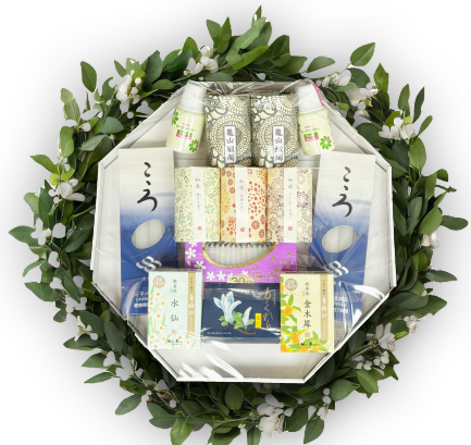
線香ろうそく セット B