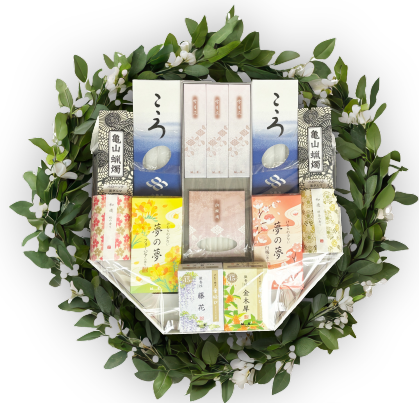
線香ろうそく セット A